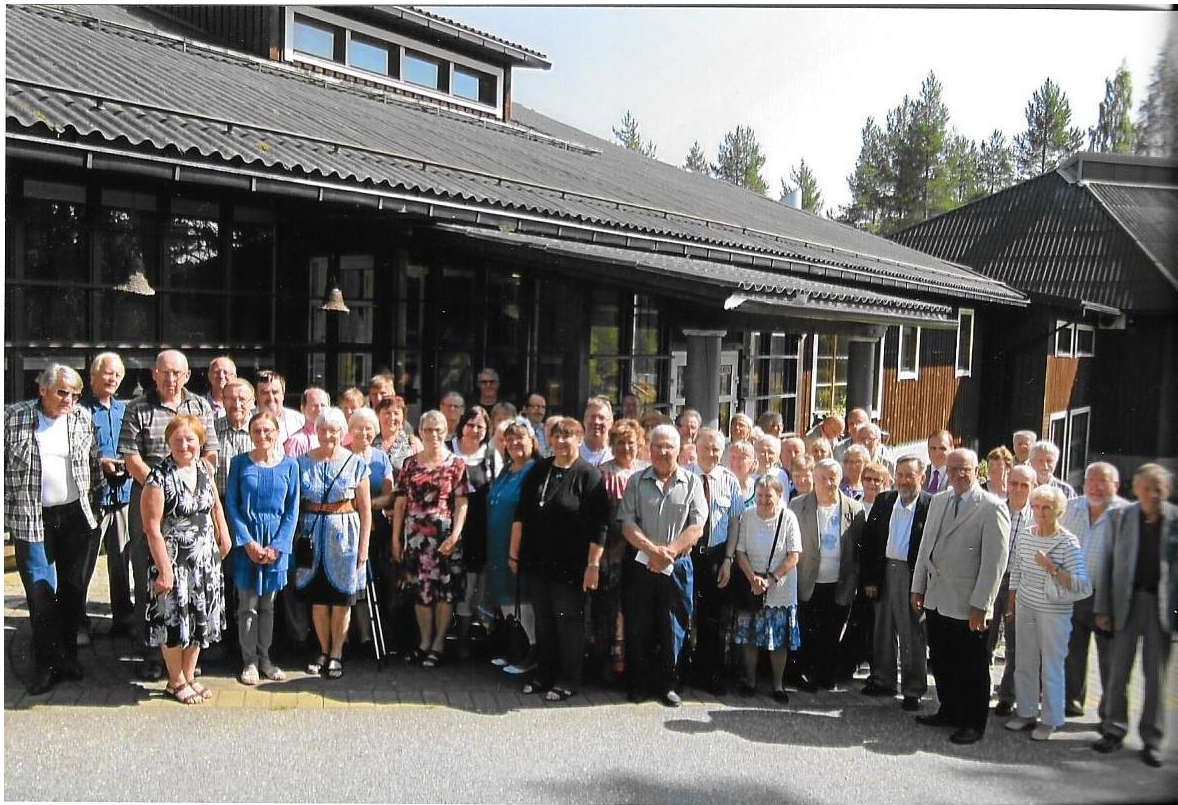
Polvijärvellä Lomakylpylä Huhmariin Räsäset kokoontuivat viimeksi eli vuonna 2013. Siellä nykyinen hallituksen valittiin.