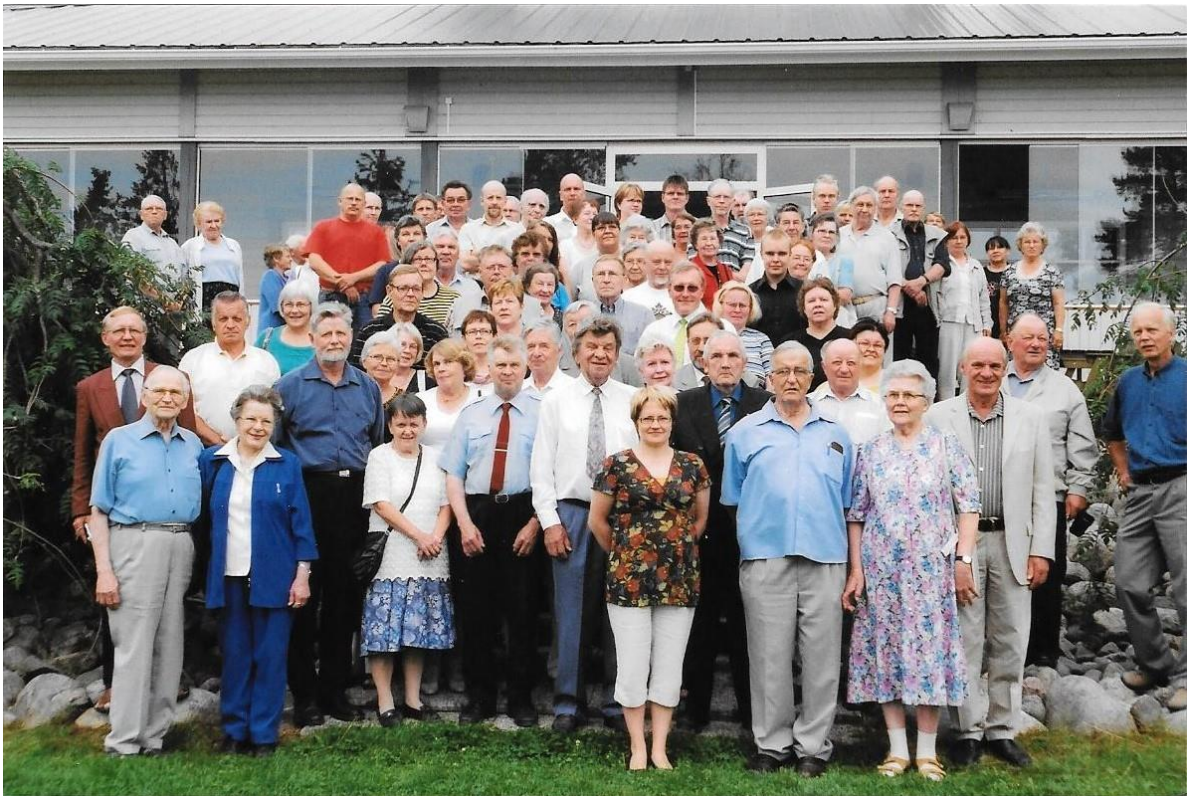
Sukukokousväkeä ja Räsäshallitus Kivennavalla 2007